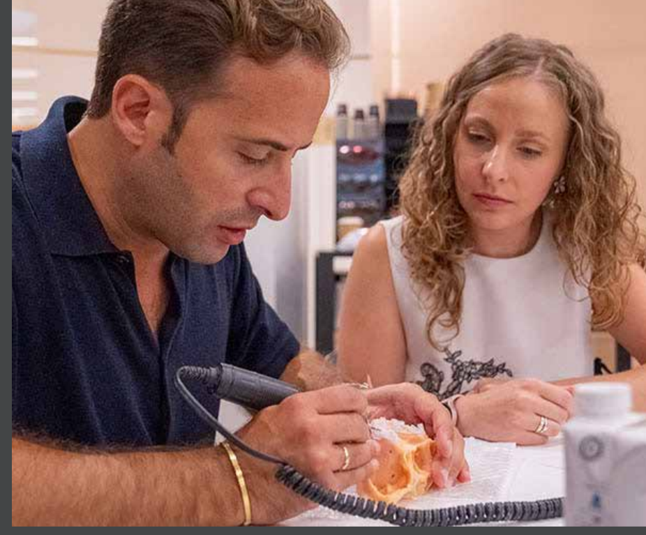
Desarrollo de taller práctico con el kit completo Fresmedical