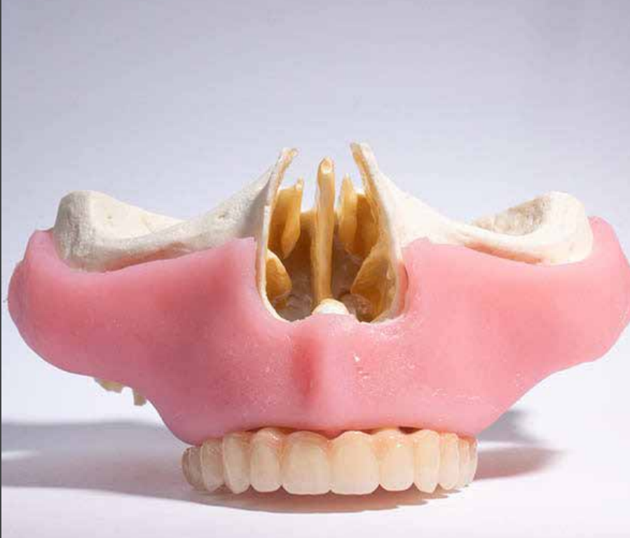
Biomodelo para taller práctico