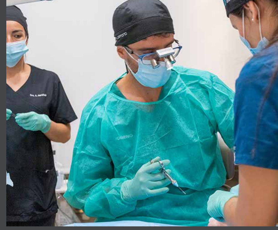
Cirugía en directo