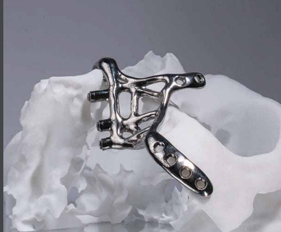
Implante subperióstico Fresmedical