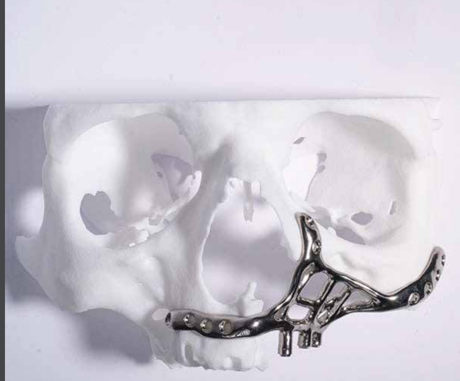
Implante subperióstico Fresmedical